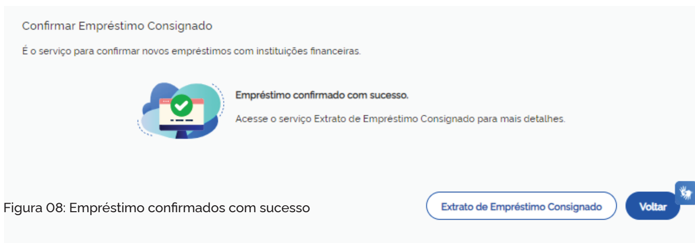
Figura 08: Empréstimo confirmados com sucesso