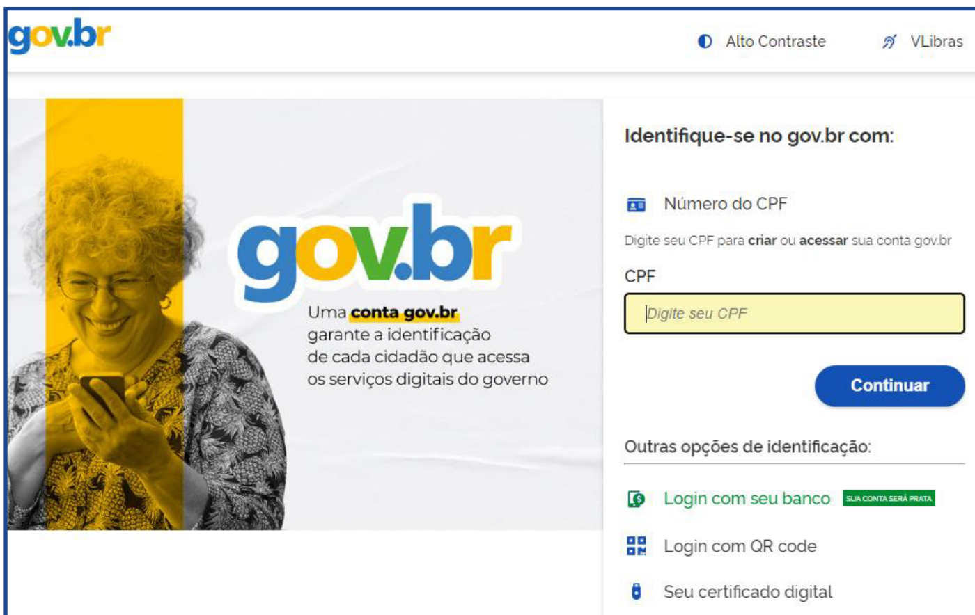
Figura 02: Janela para informar CPF