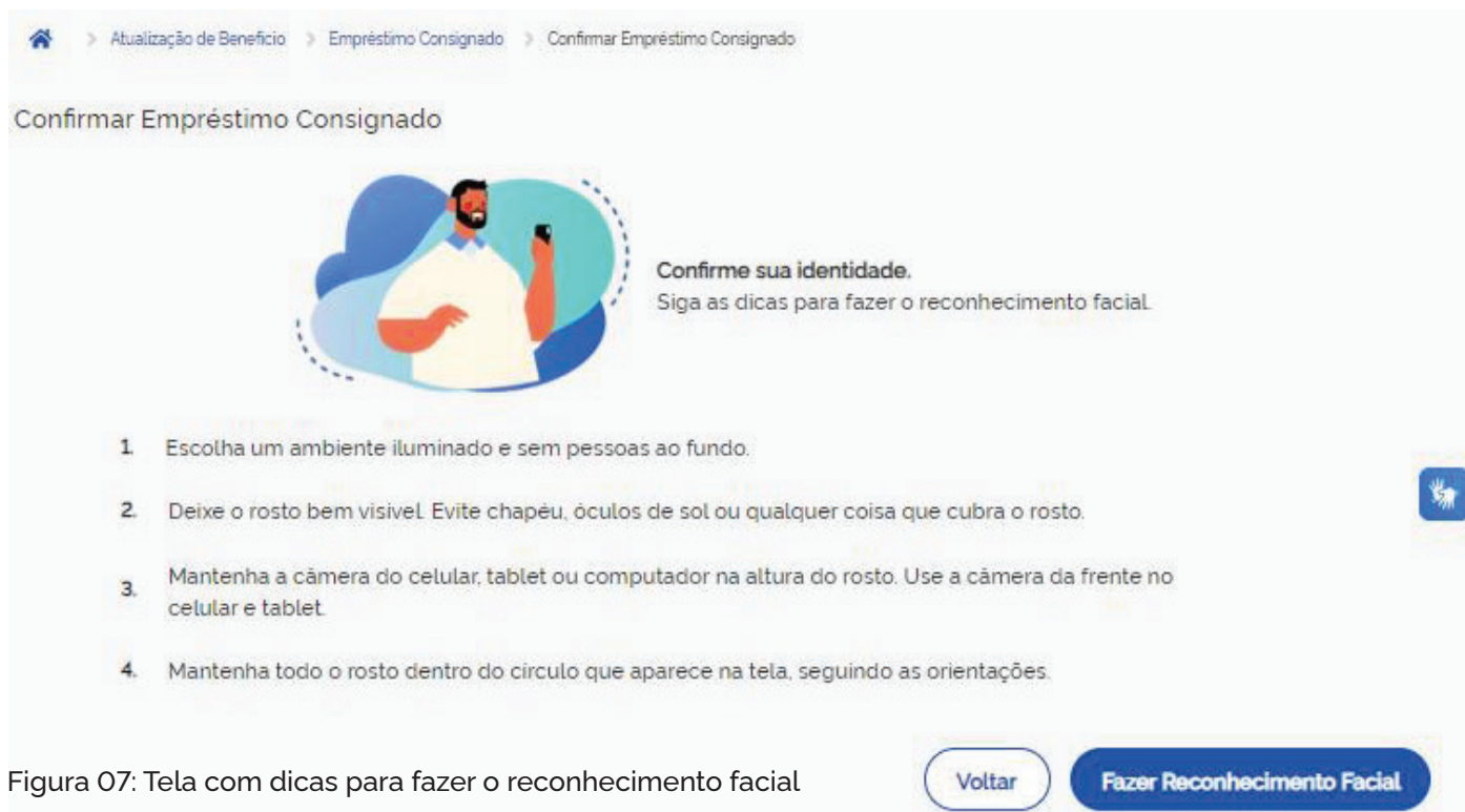
Figura 07: Tela com dicas para fazer o reconhecimento facial