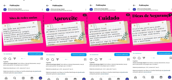
Figura 1. Produções Publicadas no Instagram

Esta pesquisa foi desenvolvida com dois grupos de alunos do Ensino Fundamental 2 da escola NMO. O primeiro grupo (Produtor) foi constituído por alunos que estavam matriculados, do 6º ano A e 8º ano. O segundo grupo (Receptor) foi formado por alunos das turmas do 6º ano B e 7º ano U. Os encontros focais foram realizados durante as aulas, em sala, utilizando celulares. A coleta de dados ocorreu por meio de questionários, análise de material produzido para a rede social e relatos dos estudantes.